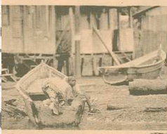
Los aprenden a pescar y a conocer los de la selva y del océano Pacífico.