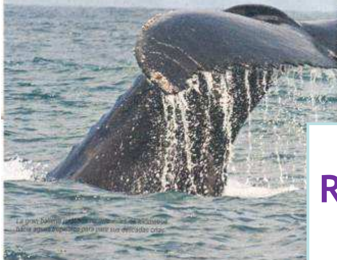
La gran ballena jorobada que vive en las costas de Chocó sale a aguas profundas para parir sus delicadas crías

En Chocó, la naturaleza nos lleva de una pequeña criatura a una descomunal, de más de 40 toneladas, que deambula frente a El Al-