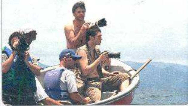
Bahía Solano es un paraíso para los aficionados a la fotografía

Colombia, turísticamente, ha experimentado una gran alza, pero a veces Cartagena de Indias o San Andrés opacan otros destinos. La zona norte de la costa Pacífica, como Nuquí y Bahía Solano, son lugares donde el ecoturismo tiene un enorme futuro, aunque para nosotros recién comienzan a sonar.