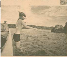
Solano y en Nuquí se puede bucear y teo para ver arrecifes de coral.

En abril y mayo, durante el espectáculo es mágico en Jairo, administrador turístico.