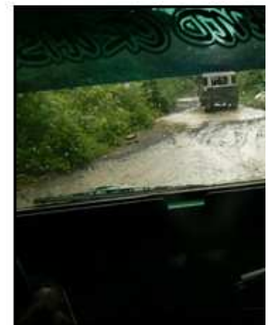
The road to El Valle, on Colombia's Pacific Coast. It's hundreds of kilometers of ruts, potholes and more by Max Hartshorne

I took a trip in August to a place that definitely fits in the former category. It was to Colombia's Choco province, located about 100 kilometers (62 miles) south of Panama.